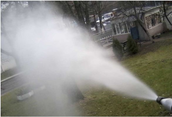
Рис. 2. Форма струменя з максимальним кутом розпилення ( d_n=1,8\text{мм} , p\geq 12\text{МПа} )

Загальний вигляд дослідного зразка брендспойта і адаптерів до нього представлений на рис. 3.