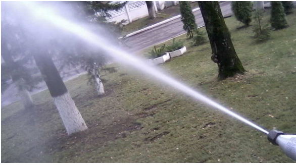
Рис. 1. Форма струменя з мінімальним кутом розпилення ( d_n=1,8\text{мм} , p\geq 12\text{МПа} )